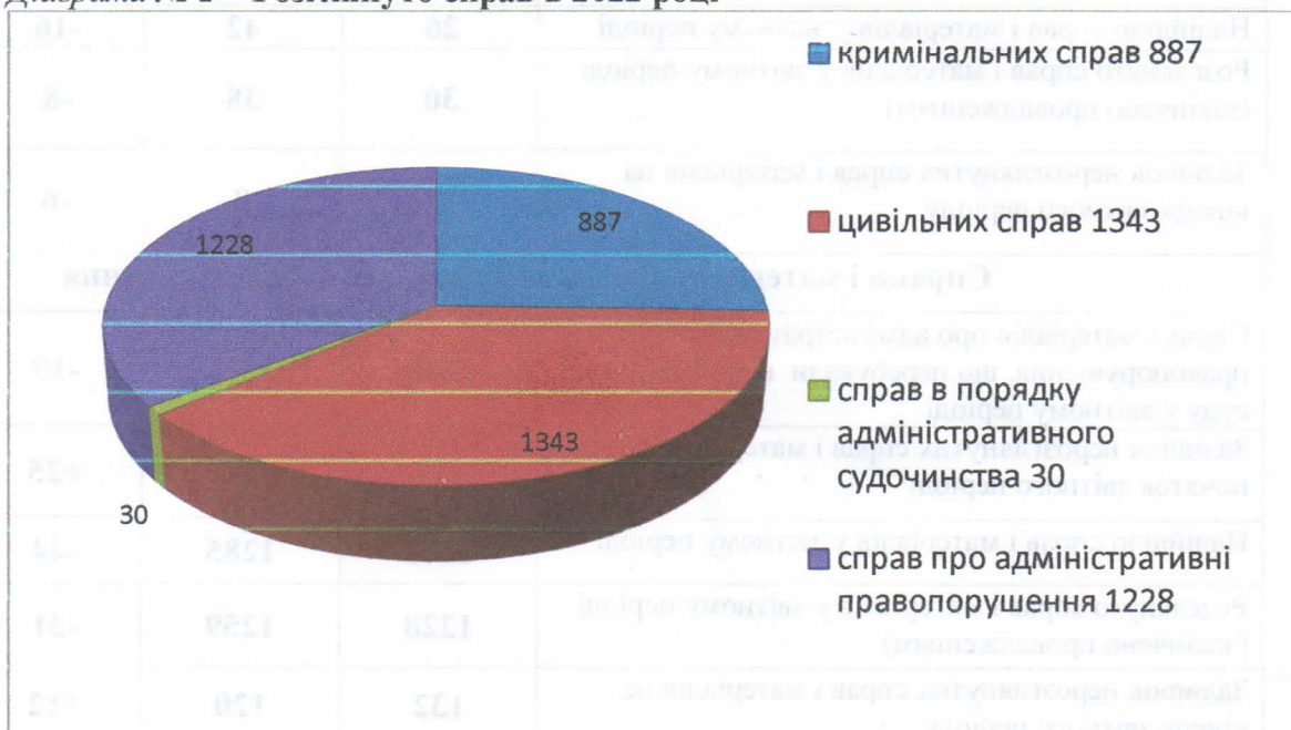
Діаграма № 2 Розглянуто справ в 2022 році

Судьями Жмеринського міськрайонного суду Вінницької області за звітний період 2021 року розглянуто 3488 справ усіх категорій. Наведено у діаграмі №2.