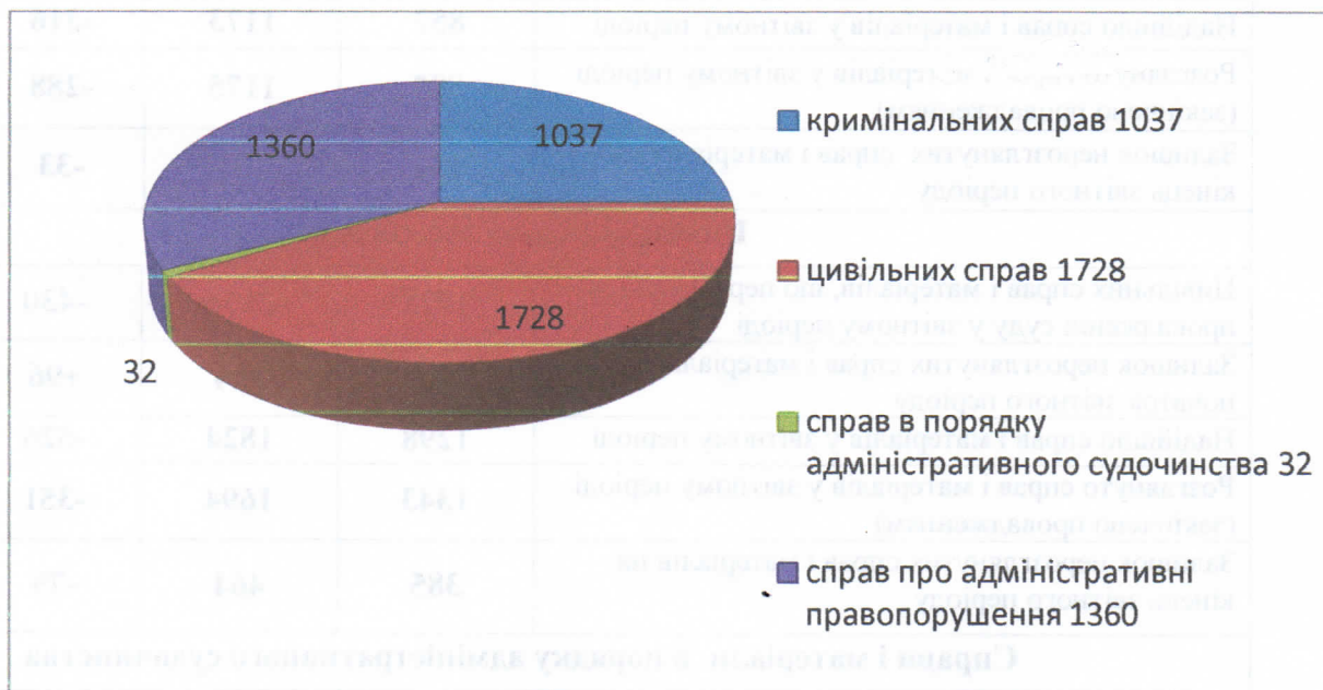
Загальна кількість справ за 2022 рік

Судьями Жмеринського міськрайонного суду Вінницької області за звітний період 2021 року розглянуто 3488 справ усіх категорій. Наведено у діаграмі №2.